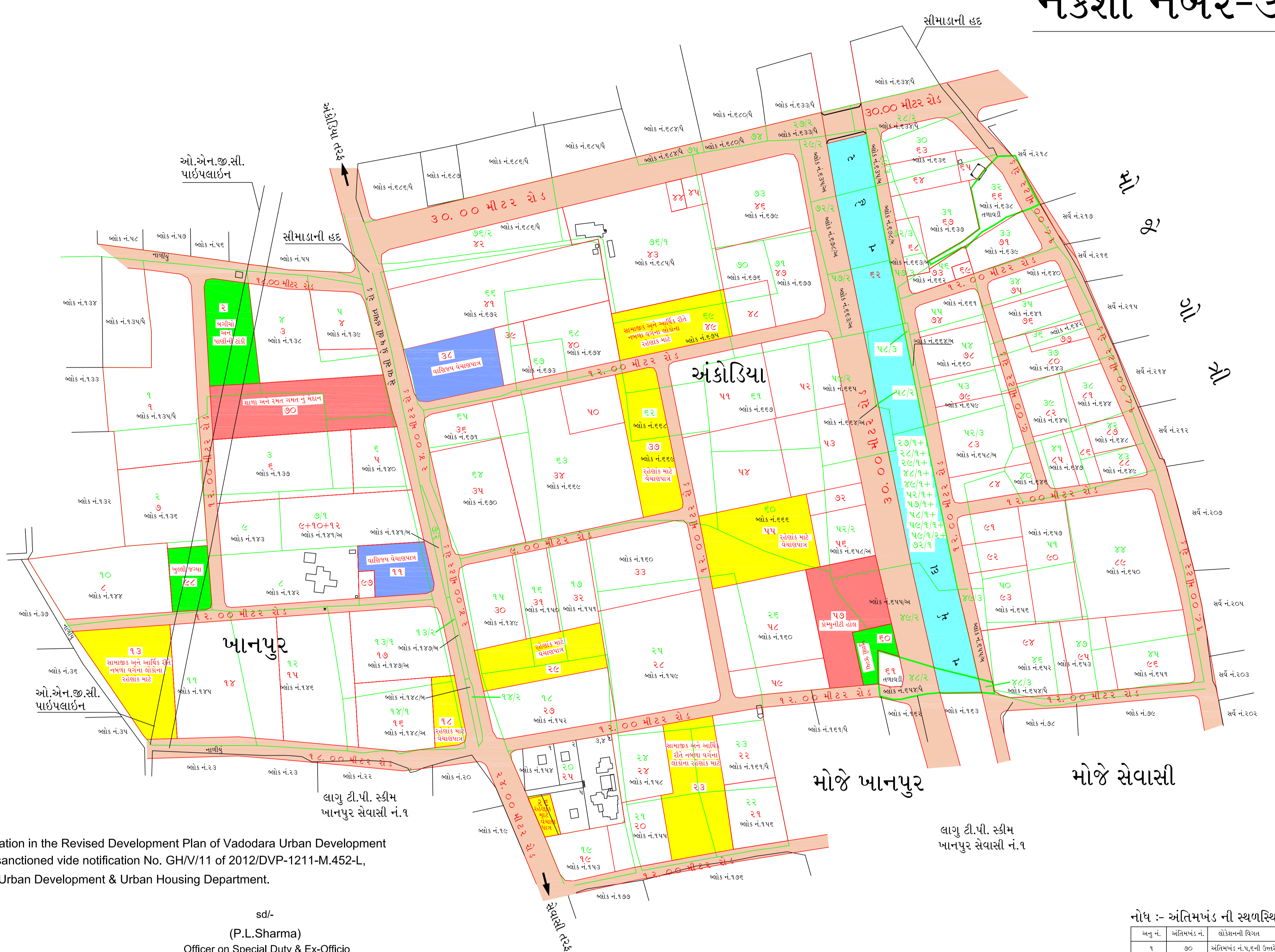
Plan showing modification in the Revised Development Plan of Vadodra Urban Development Authority, Vadodra sanctioned vide notification No. GH/V/11 of 2012/DVP-1211-M.452-L, Dated.18.01.2012 of Urban Development & Urban Housing Department.